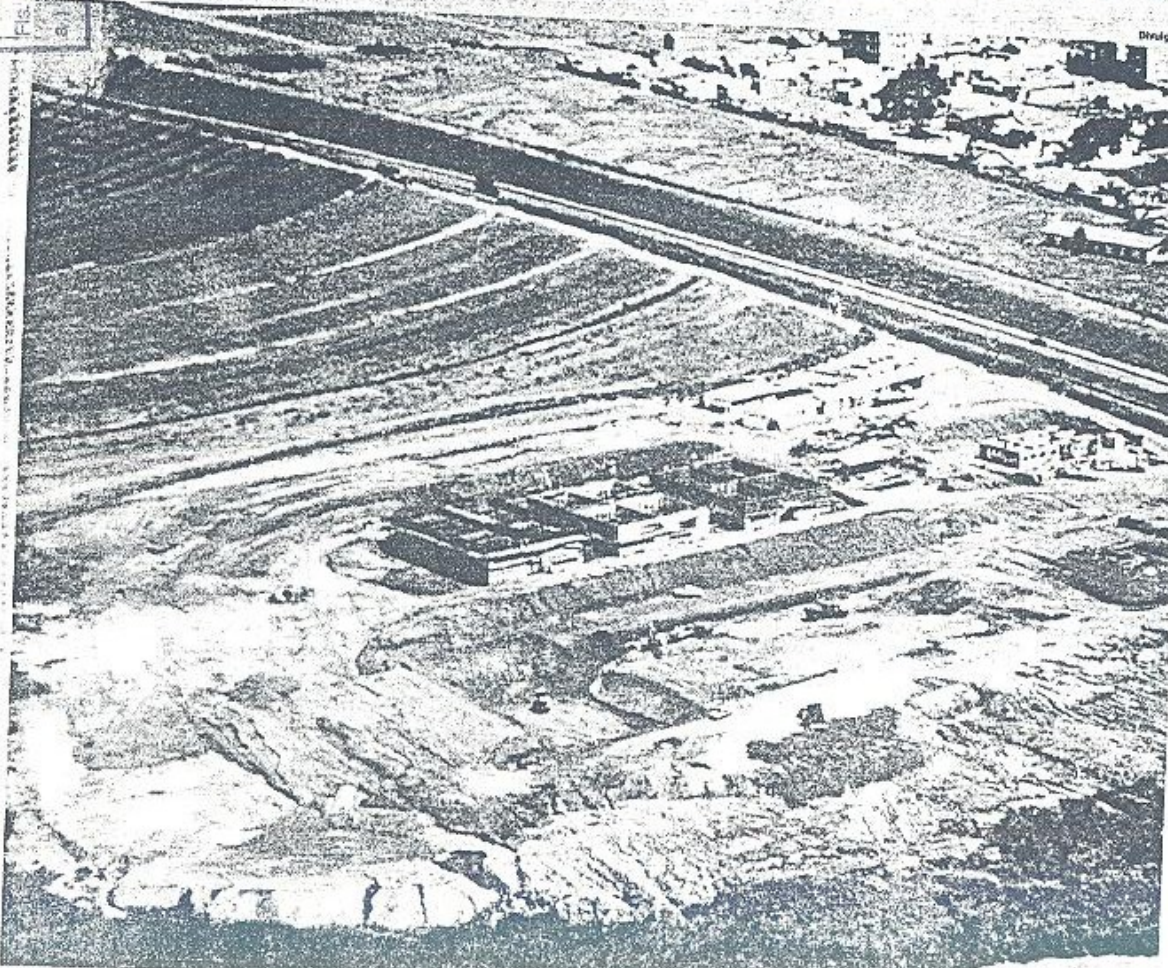
Vista aérea da estação de tratamento de Piracicaba, um investimento de R$ 9 milhões para tratar o esgoto de apenas uma região da cidade